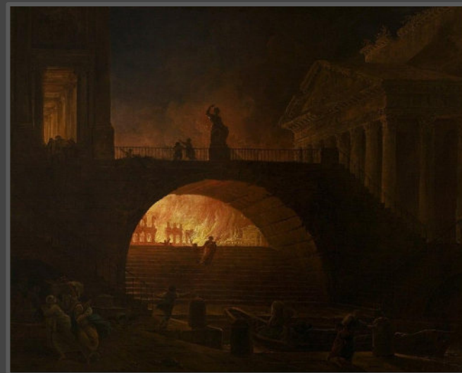
The Fire of Rome by Hubert Robert (1785).

W książce “Quo Vadis” jest przedstawiony jako młody, niestabilny oraz niezdolny do samodzielnego myślenia tyran, gotowy wyrzucić swojemu ludowi krzywdę, byleby zaspokoić swoje maniackalne ambicje. Jest to postać jednoznacznie i kompletnie negatywna, bez dynamiki osobowości.