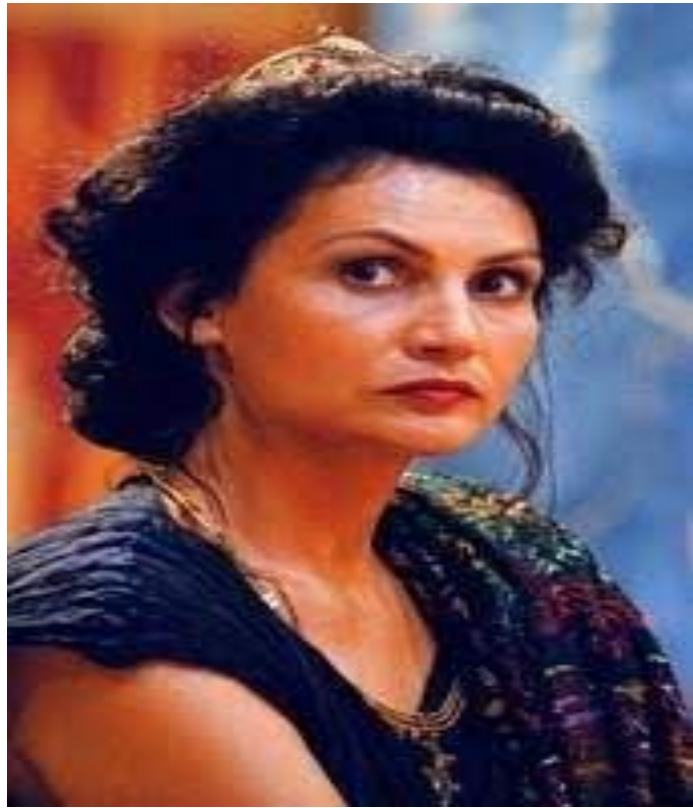
Akte w ekranizacji powieści z 2001 roku