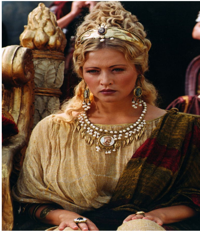
Poppea Sabina z filmu "Quo vadis" z 2001 roku