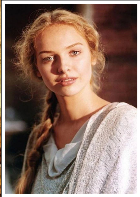
Ligia z filmu Quo vadis z 2001