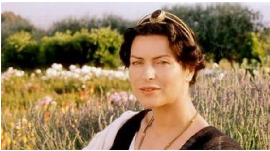
Pomponia Grecyna z filmu "Quo vadis" z 2001 roku

Głowę miała małą i drobną co czyniło wrażenie, że jest ona młodą kobietą. Grecyna była chrześcijanką, przez co często była oskarżona o wyznawanie obcych zabobonów. Petroniusz opisywał ją, jako istny cyprys oraz określał jako univirę, czyli kobietę zamężną tylko raz. Podziwiał też w niej szlachetność jej postawy, ruchów i słów.